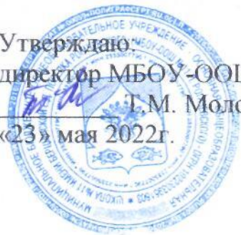
График работы школьной библиотеки в летний период 2022г.