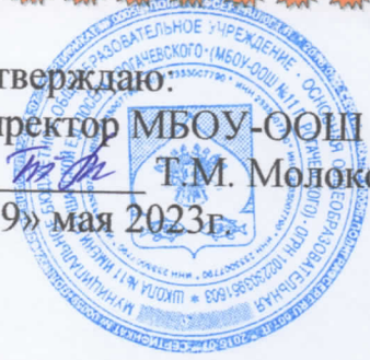
График работы школьной библиотеки в летний период 2023г.